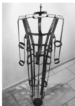
Urnhüllen Körper und körperlose Hülle: Thums Engel trifft auf Chantelle