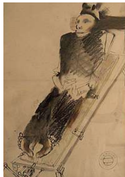
Der Tod zweimal theatralisch: bei Thum und bei Kantor (Bildzitate)