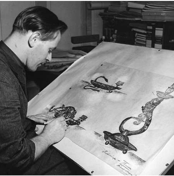
Photodokument aus dem Nachlass: «Ehwürde» aus jungen Jahren